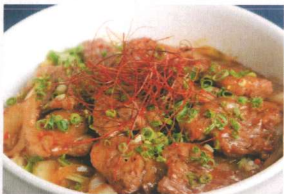
あか牛焼肉丼 (スープ付き)