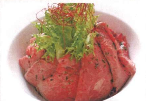
あか牛ローストビーフ丼 (スープ付き)