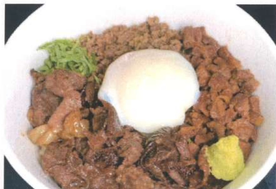
あか牛よかよか丼 (スープ付き)

'Yoka-Yoka' special AKAUSHI bowl with soup